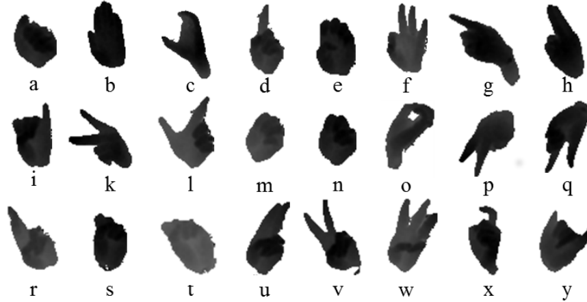
Figure 1: Exemples de silhouettes de mains, correspondant aux lettres de l'alphabet de l'ASL (American sign Language), issues de la base de données de l'Université Jadavpur.

Un des objectifs de cette thèse est de tenir compte des informations 3D issues des données et d'en déduire des caractéristiques géométriques pertinentes permettant de discriminer les classes de signes. Plus précisément, nous souhaitons, d'une part, étendre à la dimension 3 certains outils développés pour l'analyse des courbes 2D afin d'obtenir des caractéristiques géométriques discriminantes et, d'autre part, les utiliser dans le cadre de la reconnaissance de signes, où les données obtenues peuvent être bruitées. Plusieurs pistes sont à considérer et à explorer.