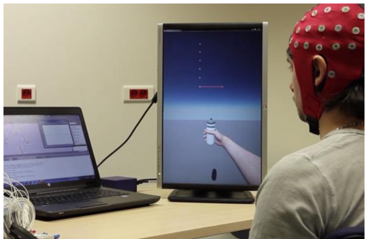
Illustration d'une interface cerveau-ordinateur pour la rééducation post-AVC. L'utilisateur imagine compresser une bouteille. La main virtuelle effectue le mouvement proportionnellement à la qualité de l'imagination motrice mesurée par électroencéphalographie.

Si ces recherches ne visent pas encore à « améliorer l'homme », elles cherchent pour le moins à le « soulager, le réparer » avec des applications dans le domaine médical qui concernent des patients avec des handicaps moteurs ou cognitifs, comme les victimes d'accidents vasculaires cérébraux, les personnes amputées, paralysées ou avec des déficits de l'attention. Ces outils sont aussi étudiés dans un tout autre domaine : « Des applications ont lieu dans l'univers du jeu vidéo immersif, où l'intérêt est d'évaluer l'état de fatigue du cerveau pour modifier les capacités d'un avatar », explique Laurent Bougrain.